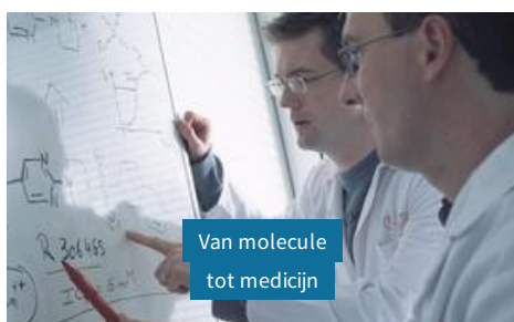
Van molecule tot medicijn