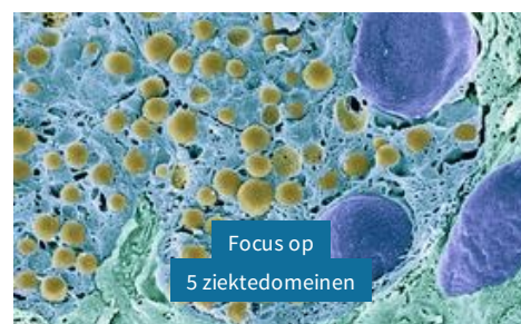
Focus op 5 ziektedomeinen