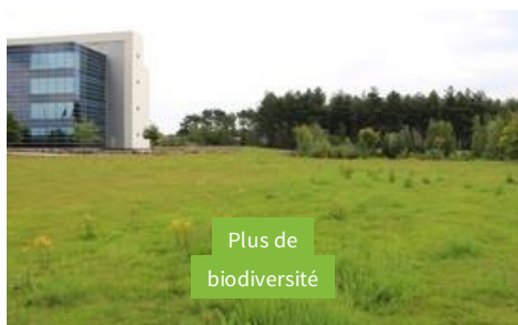
Plus de biodiversité