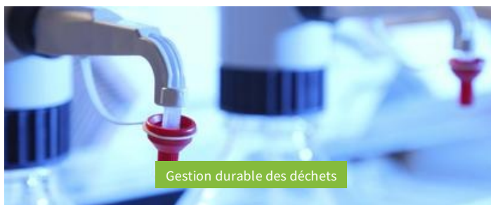
Gestion durable des déchets