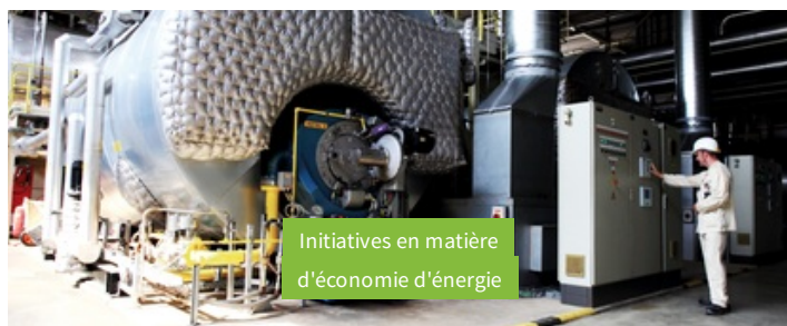
Initiatives en matière d'économie d'énergie